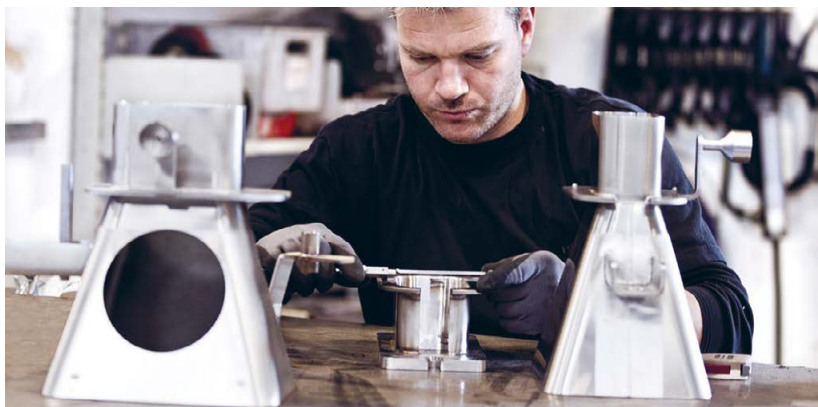
Brimas producerer kundespecifikke specialopgaver i rustfrit stål, aluminium og jern.

”Systemet har store fordele i forhold til dokumentation og har ligeledes en rigtig god søgefunktion, så man altid kan finde tilbage i tidligere bilag. Så kan man se, hvad man har købt tidligere og sammenligne ting og sager, men mest af alt giver det en effektivitet i vores bogholderi”. Det