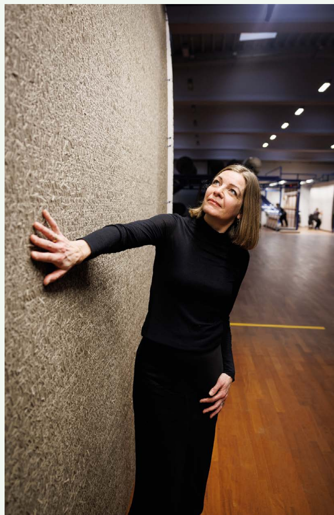
For Dansk Wilton skal ESG-arbejdet give mening hele vejen rundt - også i produktionen. Det har resulteret i konceptet ORIGIN, hvor tæpper fremstilles af ufarvet uldgarn.

”ESG-arbejdet skal prioriteres, ikke kun i ord, men også i handling. Der skal være én, der går forrest og styrer